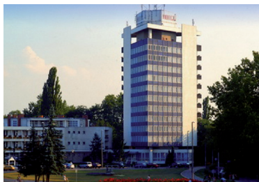
Hunguest Hotel Nagyerdő*** 4032 Debrecen, Pallagi út 5.

A szálloda a belvárosban található, a kongresszus helyszíne, a Kölcsey Központ mellett. Az ár tartalmazza: a svédasztalos reggelit, a szálloda wellness részlegén belül a medence, merülő, jakuzzik igénybevétele, valamint a fitness részleg korlátlan használatát. Parkolás: fedett mélygarázsban 2500 Ft/éj.