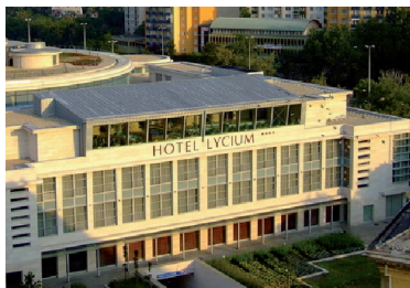
Hotel Lycium**** 4026 Debrecen, Hunyadi u. 1-3

Az előre megrendelt szállodai szobákat a résztvevő(k) nevére lefoglaltuk, azok a megküldött visszaigazolás szerint vehetők igénybe, általában az érkezés napján 14 órától az elutazás napján 10 óráig. Korábbi érkezés vagy későbbi elutazás esetén a csomagok elhelyezésében a szállodai porták nyújtanak segítséget.