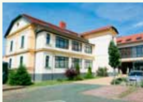
Elizabeth Hotel****Superior 5700 Gyula, Vár utca 1. http://www.elizabeth-hotel.hu/

A szálloda a belvárosban, a Gyulai Vártól mindössze 200 m-re, a kongresszus helyszínétől pedig 15 percnyi sétára található.