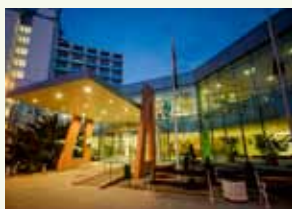
Hunguest Hotel Erkel**** 5700 Gyula, Várkert u.1. http://www.hunguesthotels.hu/hu/hotel/gyula/hunguest_hotel_erkel/

Parkolás: a szálloda parkolójában van lehetőség, a díja 500 Ft/autó/éj.