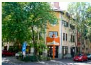
Corvin Hotel Gyula*** & Wellness Apartmanok 5700 Gyula, Jókai u. 9-11. http://www.corvin-hotel.hu/

Parkolás: a szálloda saját parkolójában ingyenes.